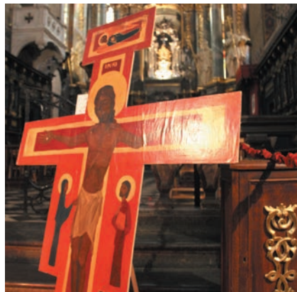
День Довіри став традиційною акцією ЕСТ

Учасники Тижня мали нагоду відвідати концерт хорового співу та